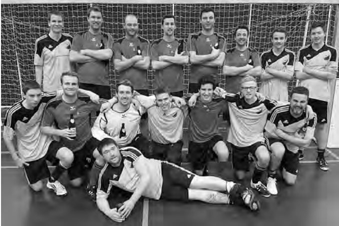
Spieler Feuerwehr Genkingen